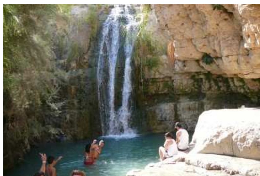
Vodopády a jeskyně En Gedi , kde se skrýval David před králem Saulem poblíž Mrtvého moře