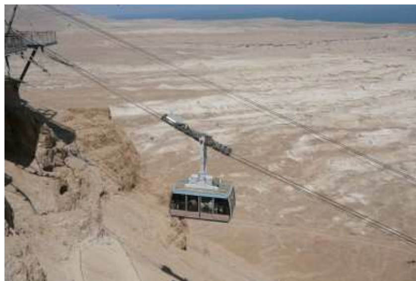
Lanovka na skalní pevnost Masada