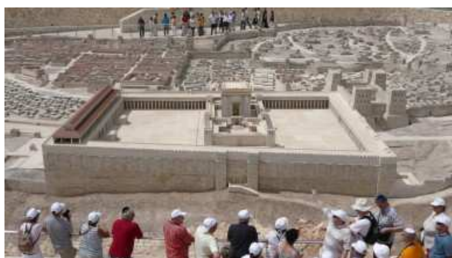
Model Jeruzaléma z období Ježíše