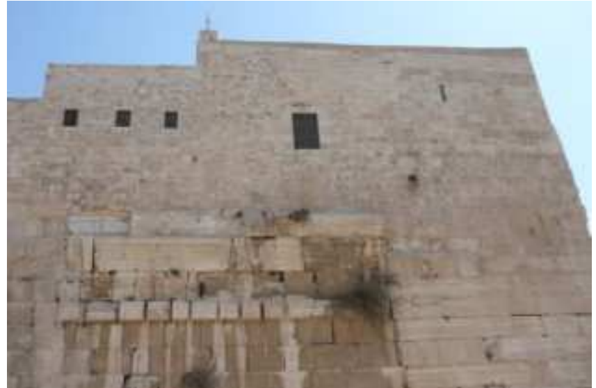
Do dnešních dnů se s Robinsonova oblouku, po kterém vedla cesta na nádvoří, zachovaly jen malé výstupky ze zdi.

Novodobý Izrael nejsou jen vykopávky pozůstatků dávné minulosti, ale je to moderní a krásná země s rozmanitou přírodou a přátelskými lidmi.