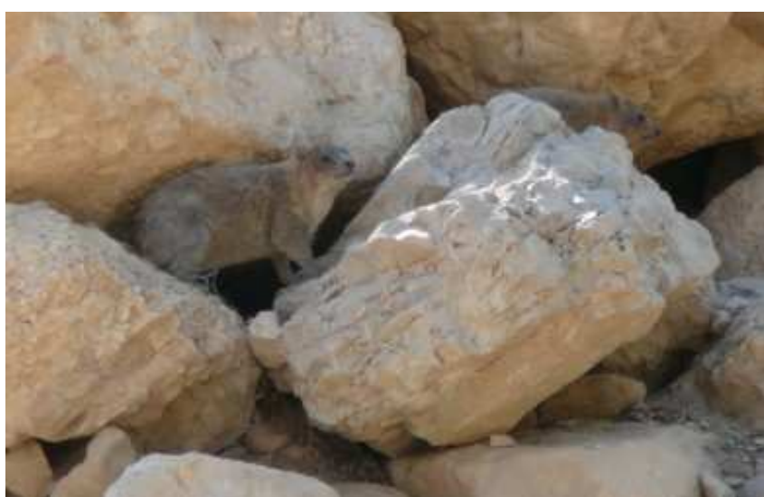
Damani skalní ↑ žijí volně poblíž pramenů En Gedi spolu s kozorohy ↑