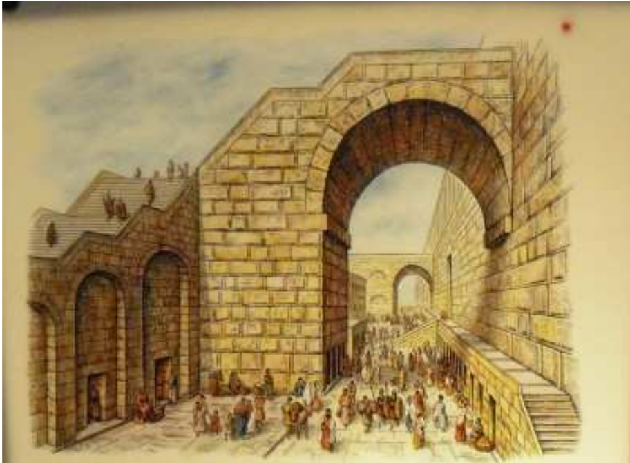
Tyropoénská cesta vedoucí pod Robinsonovým obloukem, po které zcela určitě chodil i Ježíš