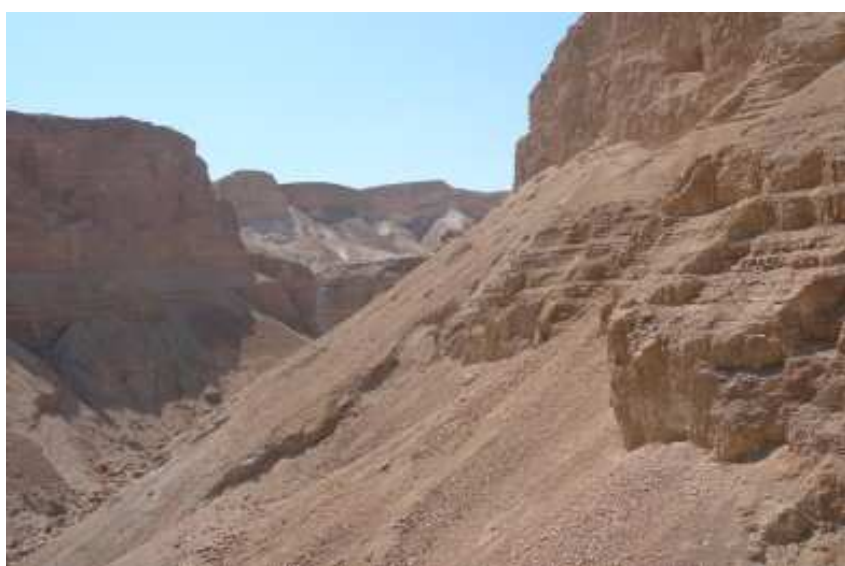
Mrtvé moře obklopuje skalnatá poušť