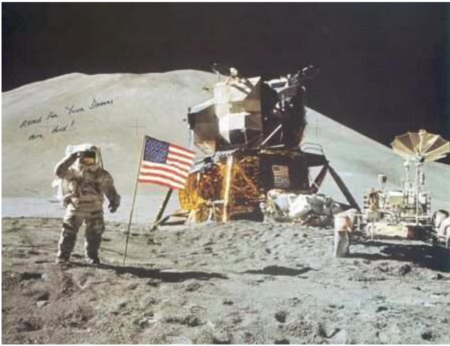
Modul APOLLO 15 a měsíční vozítko ROVER